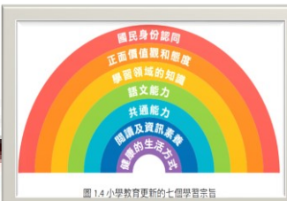
《小學教育課程指引》(2022)

為提升學校通過「策劃—推行—評估」循環的自評效能，貫徹以改善學生學習成果為架構的核心，由2022/23學年起，學校進行自評時須更聚焦於七個學習宗旨，並以此作為自評的反思點，綜合運用香港學校表現指標和自評資料及數據，從整體角度評估學校在培育學生相關素質方面的工作做得有多好，以反映學校對改善學生學習成果的效能