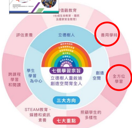
圖 1.5 小學課程持續更新的三大方向及七大重點