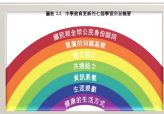
《中學教育課程指引》(2017)